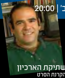
שתיקת הארכיון הקרנת הסרט לציון יום השואה הבינלאומי