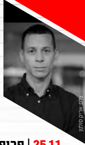
פרופ' אהרון צ'חנובר

רכישה באתר המתנ"ס | 077-7378530 | 04-6378551 שלוחה 3