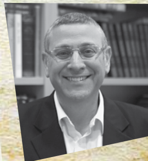
הרב ד"ר בני לאו